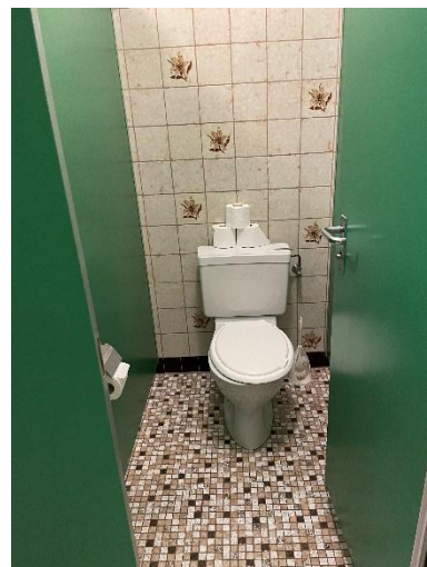
Figure 4, WC