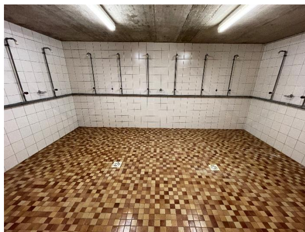
Figure 6, douches.