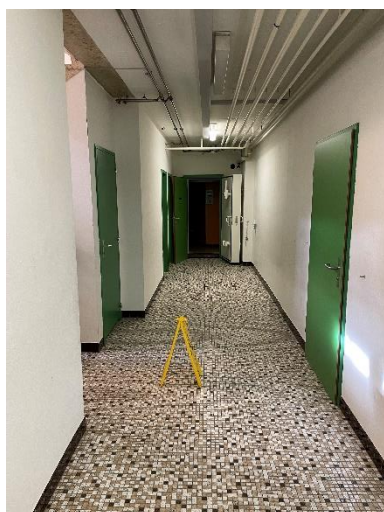
Figure 3, couloir