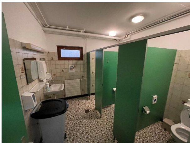
Figure 1, WC femmes. A droite un lavabo est manquant, celui-ci n'ayant pas été remplacé après avoir été cassé.

Ci-dessous, vous trouverez quelques images illustrant la vétusté des locaux :