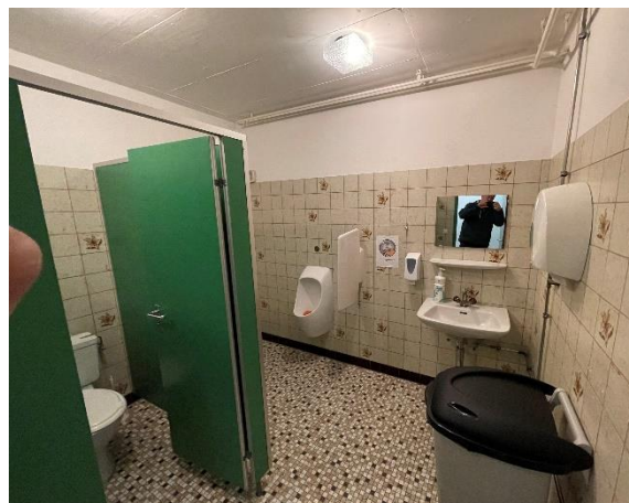
Figure 2, WC homes.